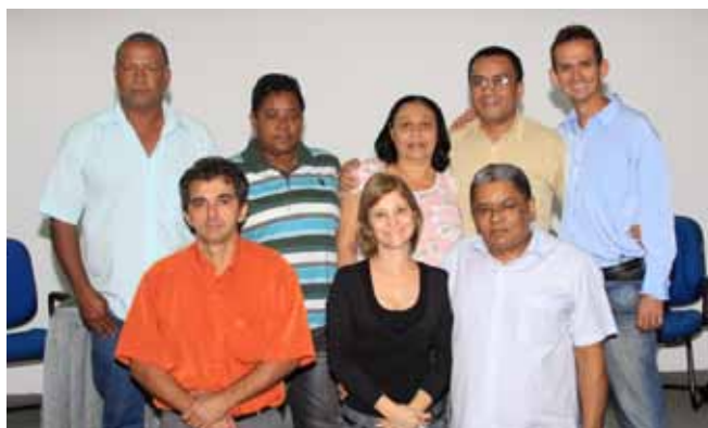
Até que enfim, secretário! Posse dos conselheiros eleitos foi no DIO, em Vitória

Finalmente a Secretaria Estadual de Saúde (Sesa) deu posse aos membros eleitos para cada Conselho Gestor dos hospitais estaduais. Os trabalhadores foram empossados pelo secretário de Saúde, no dia 29 de setembro, quase três meses depois da eleição.