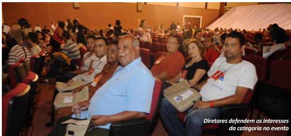
Diretores defendem os interesses da categoria no evento

“Foi um momento importante de discussão da política de saúde do nosso Estado, onde os profissionais, usuários e gestores tiveram condições de fazer suas intervenções considerando as diferenças de posições políticas, bem como expondo e defendendo as