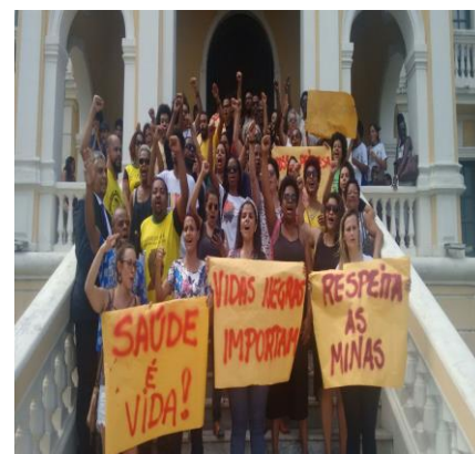
X Marcha de Combate ao Extermínio da Juventude Negra – 20/11/2017.

Dia 20 de novembro é o dia da Consciência Negra em alusão à data em que, Zumbi dos Palmares, líder da principal experiência de resistência contra o fim da escravidão, o Quilombo de Palmares, foi assassinado. Zumbi, Dandara e Tereza Benguela foram importantes personagens da história não contada, de um processo de resistência coletiva, insurreições, suicídios e criações de quilombos. História de um povo que lutou e construiu uma experiência que se tornou uma ameaça política, econômica e militar para o sistema colonial escravagista.